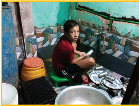
Aide à l'enfance de l'Inde et du Népal