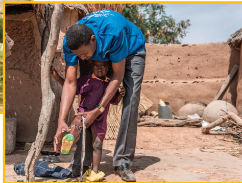
Handicap international Luxembourg