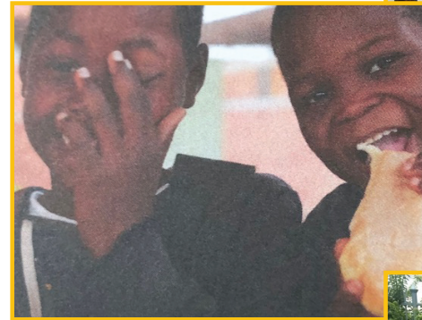
Le soleil dans la main