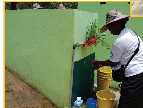
Enfants défavorisés - Madagascar