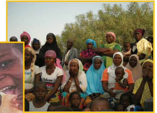
Frères des hommes