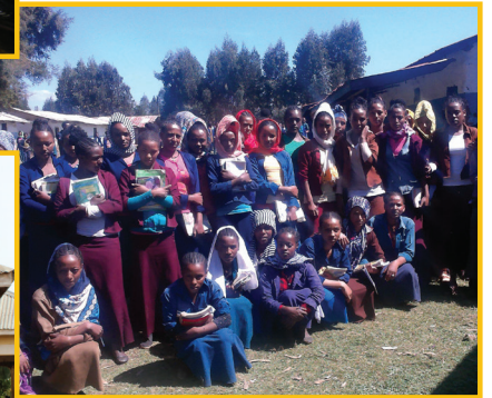
Regards d'Enfants d'Ethiopie