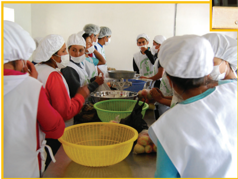
Christian Solidarity International