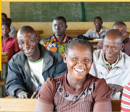
Chrèschte mam Sahel