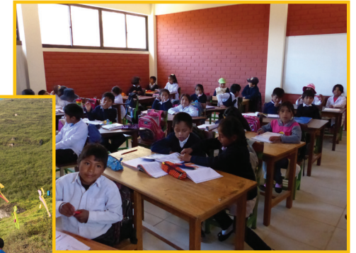
Niños de la Tierra