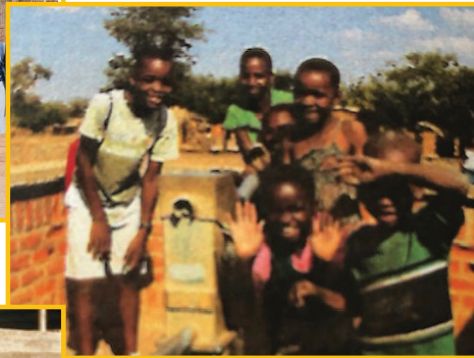
Eng oppen Hand fir Malawi